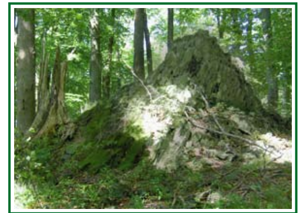
Basaltchlote auf dem Stallberg