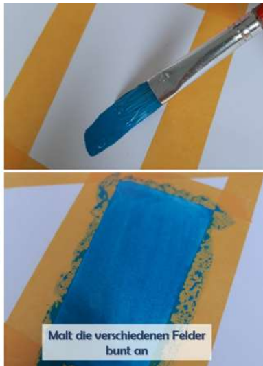
Malt die verschiedenen Felder bunt an