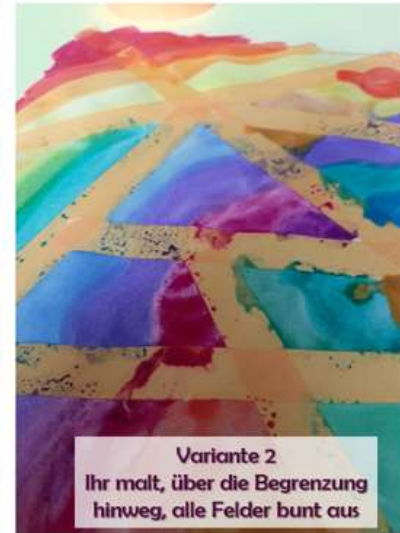
Variante 2 Ihr malt, über die Begrenzung hinweg, alle Felder bunt aus