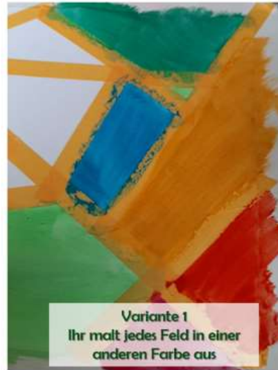
Variante 1 Ihr malt jedes Feld in einer anderen Farbe aus