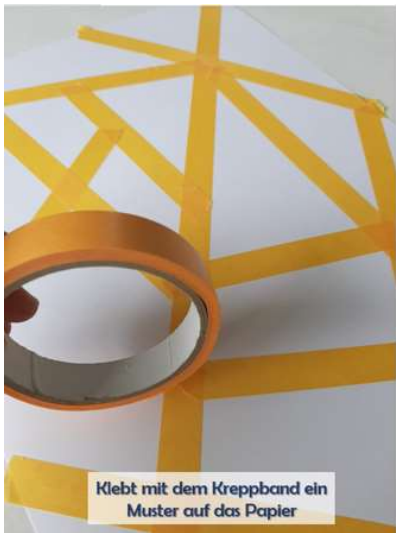
Klebt mit dem Kreppband ein Muster auf das Papier