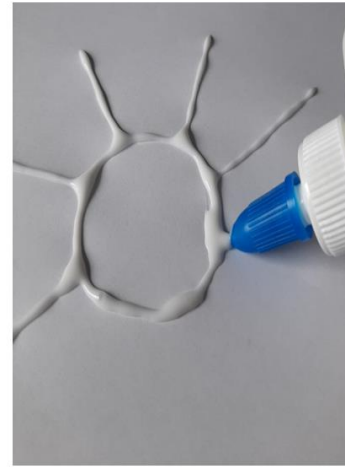
Mit dem Flüssigkleber ein beliebiges Motiv aufmalen