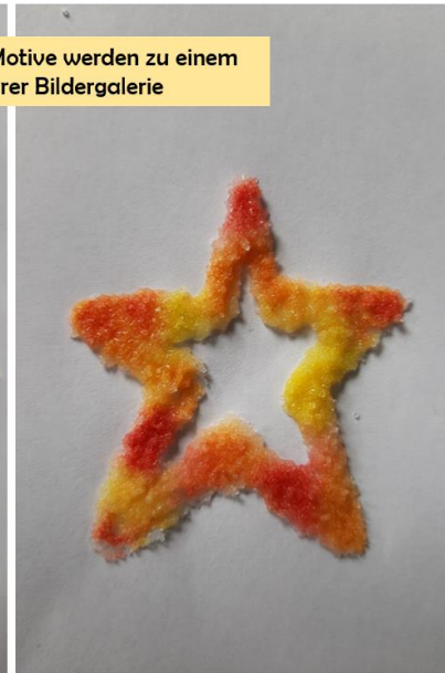
Verschiedene, bunte Motive werden zu einem Highlight in eurer Bildergalerie