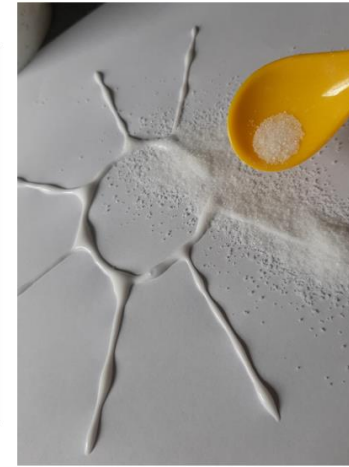
Salz großzügig darüber streuen, dann das überschüssige Salz abschütteln