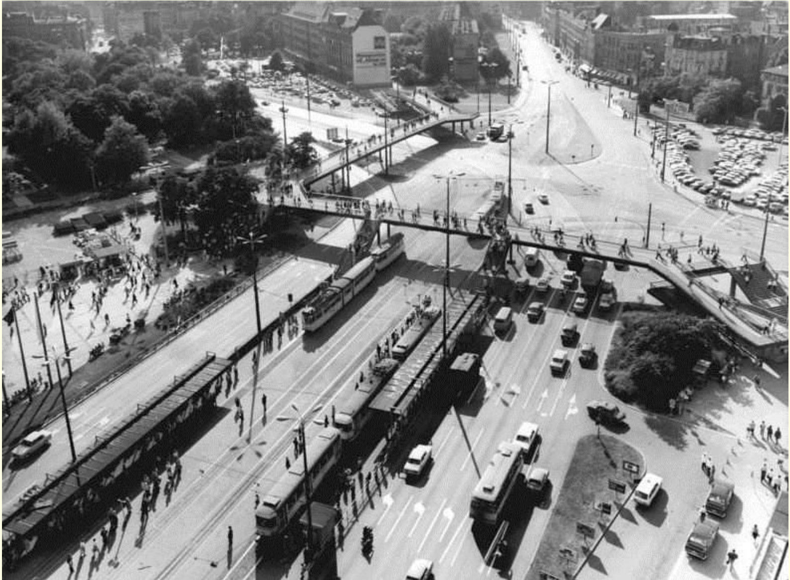
Leipzig: Blick auf den Friedrich-Engels-Platz mit Fußgängerbrücke.